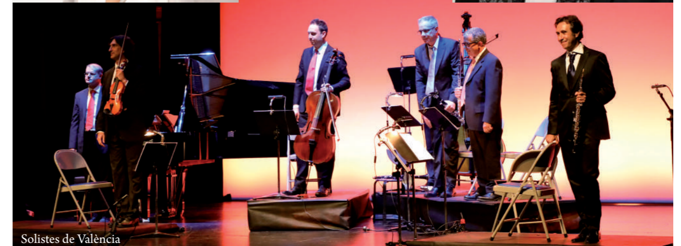
Solistes de València