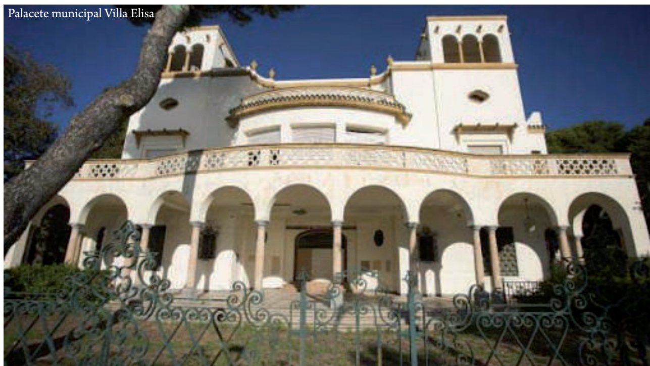
Palacete municipal Villa Elisa